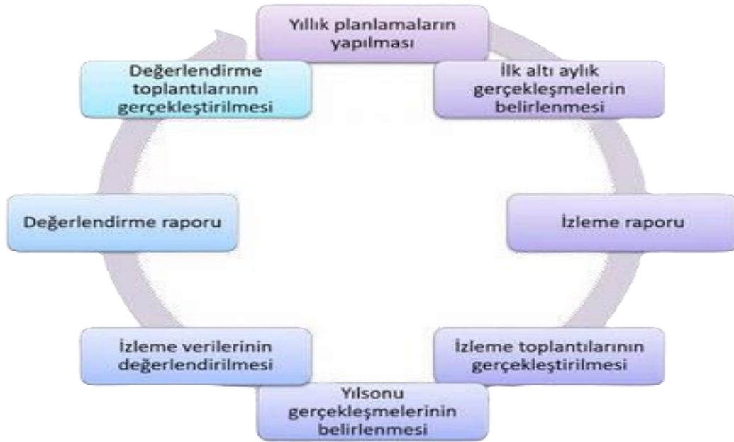
Şekil 7: İzleme ve Değerlendirme Süreci

İzleme ve değerlendirme sürecinin işleyişi ana hatları ile aşağıdaki şekilde özetlenmiştir. MEB 2024–2028 Stratejik Planı’nda yer alan performans göstergelerinin gerçekleşme durumlarının tespiti yılda iki kez yapılacaktır. Ara izleme olarak nitelendirilebilecek yılın ilk altı aylık dönemini kapsayan birinci izleme kapsamında, MEB Stratejik Plan İzleme ve Değerlendirme Modülü vasıtasıyla, Strateji Geliştirme Başkanlığı tarafından harcama birimlerinden sorumlu oldukları performans göstergeleri ve stratejiler ile ilgili gerçekleşme durumlarına ilişkin veriler toplanarak konsolide edilecektir. Performans hedeflerinin gerçekleşme durumları hakkında hazırlanan “Stratejik Plan İzleme Raporu” Bakan, Bakan yardımcıları, birim amirleri ve kurum içi paydaşların görüşüne sunulacaktır. Bu aşamada amaç, varsa öncelikle yıllık hedefler olmak üzere, hedeflere ulaşılmasının önündeki engelleri ve riskleri belirlemek ve yıllık hedeflere ulaşılmasını sağlamak üzere gerekli görülebilecek tedbirlerin alınmasıdır.